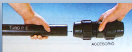
Aproximação do tubo de P.E. ao acessório

O primeiro fittings do mercado de montagem rápida e simples, apresentado como NOVIDADE na FEIRA AMBIENTE 1990 BILBAO