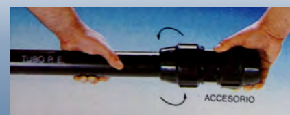
Aperto do adaptador para seleccionar o tubo de P.E.