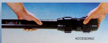
Tubo de P.E. introduzido no acessório